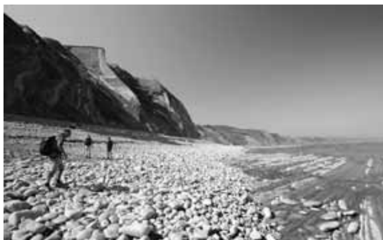
Imagen del flysch.

Los deportes acuáticos también tienen su sitio en Debabarrena. El surf y las excursiones subacuáticas se pueden practicar a lo largo del año, especialmente en Mutriku. Cada fin de semana la plaza de Lastur se convierte en una