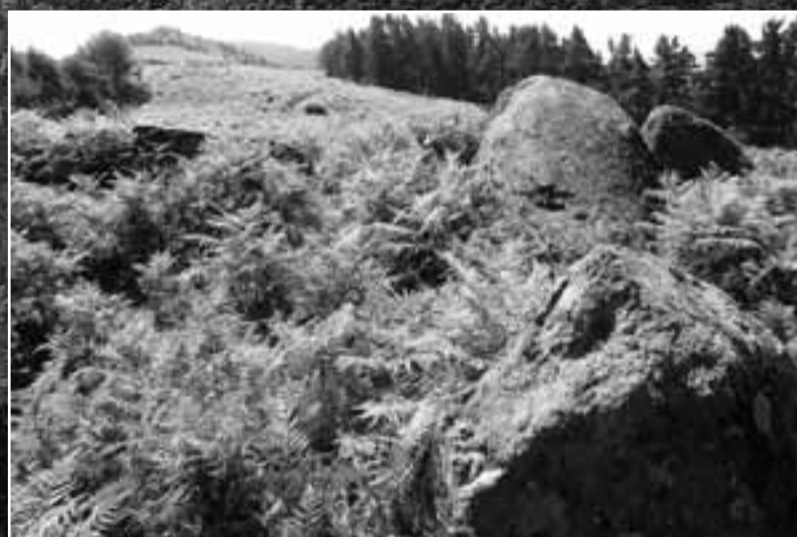
Algunos de los dólmenes que se pueden encontrar en la ruta.