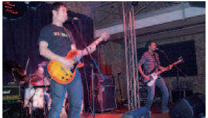
EH Sukarrak hilaren 18an joko du Untzagan, Reno Renardo taldearekin.

Oraindik ez da jakitera eman, baina lehengoan Emakumearen Mahaikoekin elkartu ginen eta jarrera positiboa aurkeztu zuten. Zerbaite egiteko asmoa zuen jendea ikusi genuen.