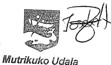
Ms. Josebe Astigarraga Mayor of Mutriku